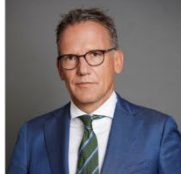
Ulrich Höller Vizepräsident des ZIA