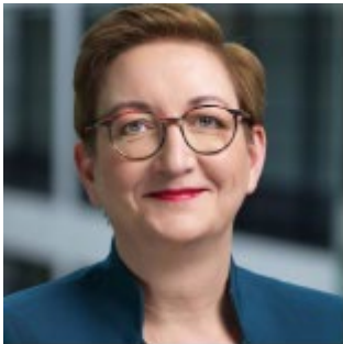
Klara Geywitz, Bundesministerin für Wohnen, Stadtentwicklung und Bauwesen