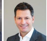
Timo Tschammler TwainTowers GmbH © TwainTowers GmbH