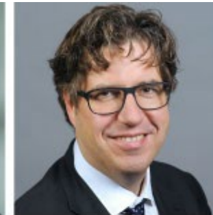
Michael Kellner, Parlamentarischer Staats- sekretär beim Bundesminister für Wirtschaft und Klimaschutz