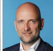
Martin Rodeck Blacklake GmbH © EDGE (Technologies GmbH)